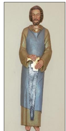
Statue de saint Joseph église St-Antoine